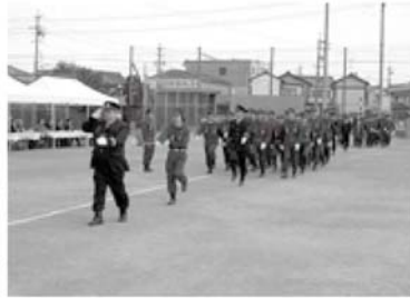
→消防団員の分列行進

なお、表彰されました分団及び団員の皆様を次のとおり紹介させていただきます。(敬称略)