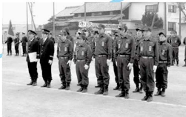
木曾岬町長表彰(優良分団表彰)を受賞した第4分団