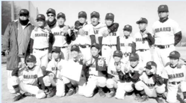
●試合結果 準決勝 木曾岬シャークス 1対3 少年瑞穂(名古屋市) 3位決定戦 木曾岬シャークス 7対3 市江クラブ(愛西市)

12月13日・23日・27日の3日間、蜂須賀球場（美和町）などを会場に開催された、平成21年度Fファイナルトーナメントにおいて木曾岬シャークスが見事3位入賞を果たしました。 「F」とはフレンドリーの略で、愛西市近隣の市町村で親交のある少年軟式野球チーム16チームで組織されており、2月から11月までのリーグ戦やこの度のトーナメント戦を開催しています。