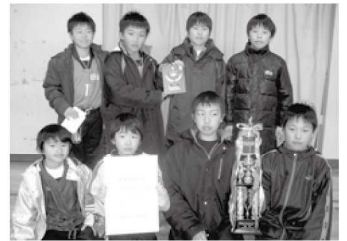
スポーツ少年団の部 優勝/サッカー少年団