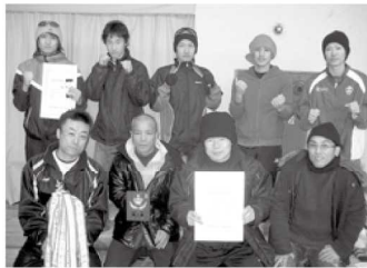
一般の部 優勝/KOZOボクシングジム