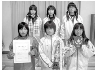
中学生女子の部 優勝/ソフトボール部A