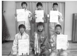
中学生男子の部 優勝/侍ジャパン