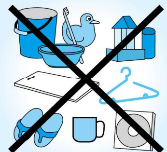
プラスチック製品は可燃ごみとなります。