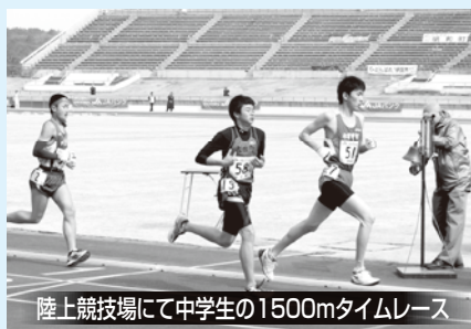
陸上競技場にて中学生の1500mタイムレース