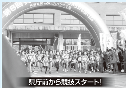
県庁前から競技スタート!