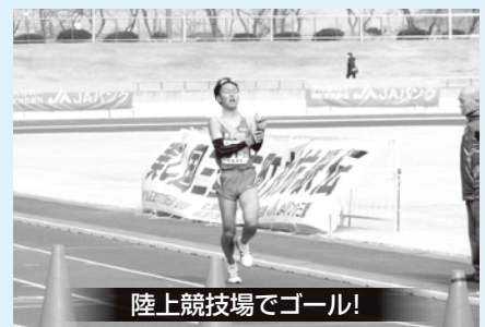
陸上競技場でゴール!