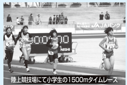
陸上競技場にて小学生の1500mタイムレース