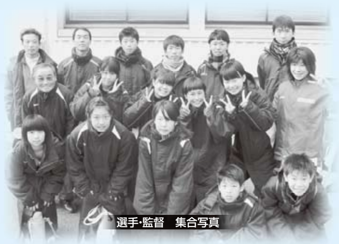
選手・監督 集合写真