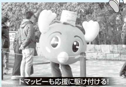
トマッピーも応援に駆け付ける!