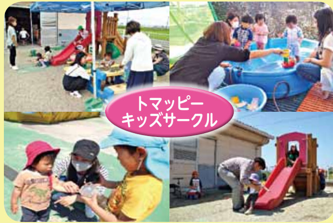
トマッピーキッズサークル