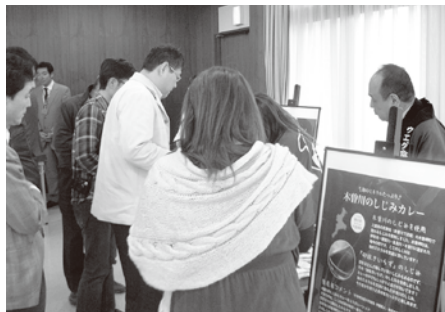
会場内で実演販売された「しじみカレー」