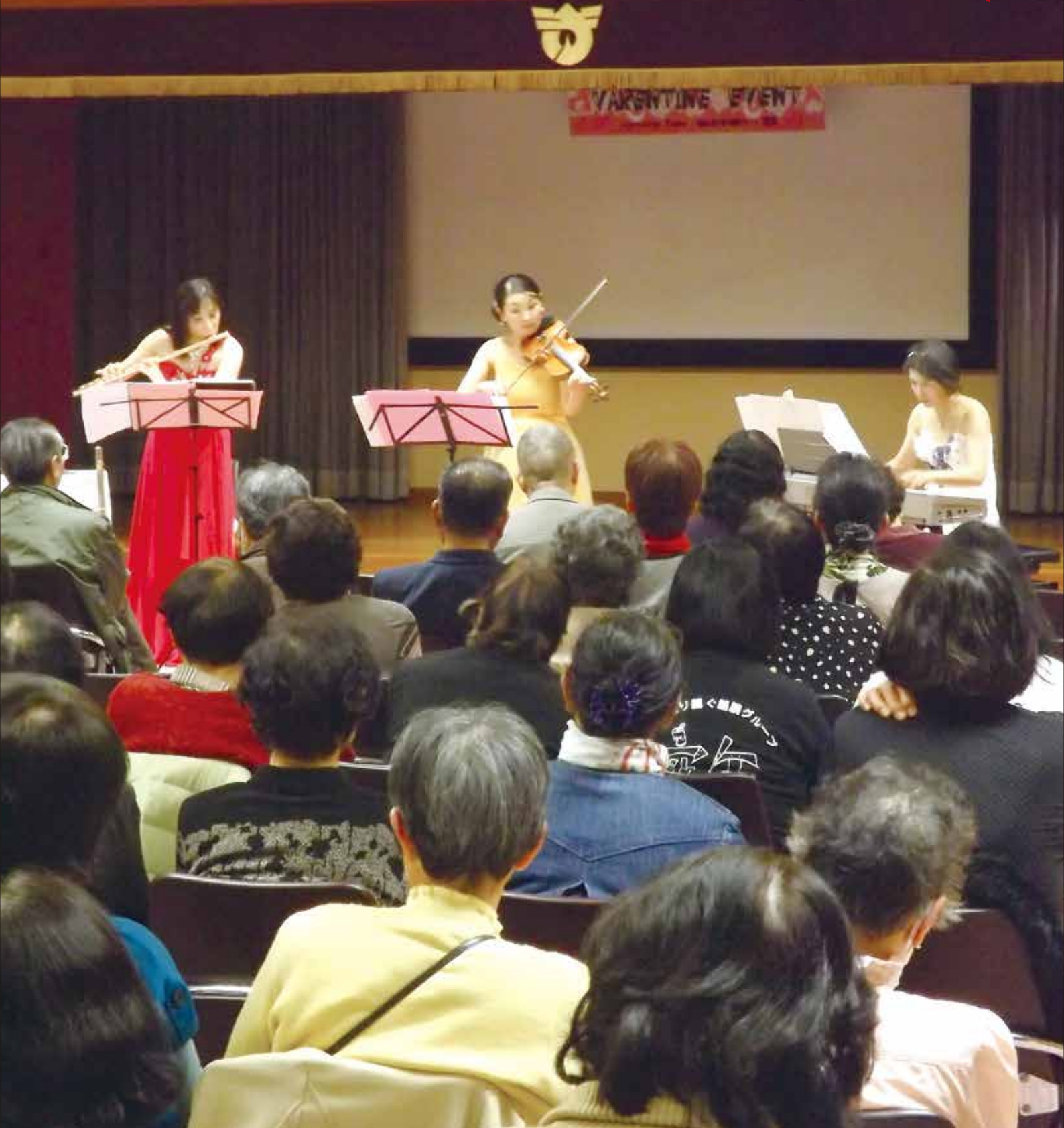
【写真】「バレンタインイベント」より