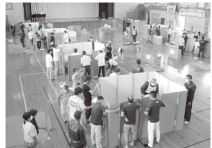
パーテーション作成中