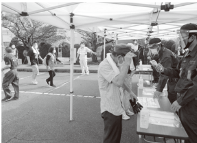
事前受付での検温

10月も台風の襲来が予想されますので、情報収集と防災備蓄品(+マスク・ウエットティッシュ・体温計)の準備を日頃から習慣づけ、災害に備えましょう。