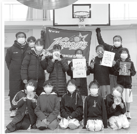
※新型コロナウイルス感染拡大防止の為、マスクを着用して写真を撮影しております。