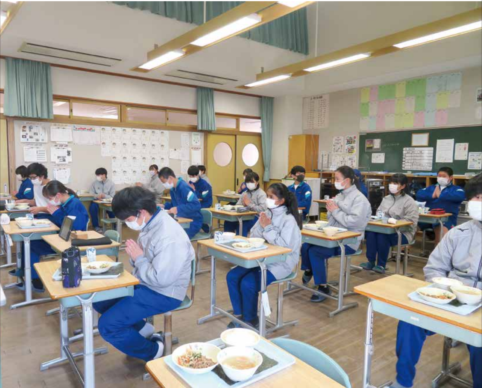
【写真】木曾中メニュー給食(関連記事P5)