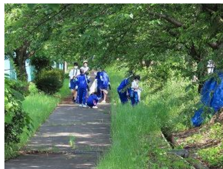
【桜堤防での清掃活動】