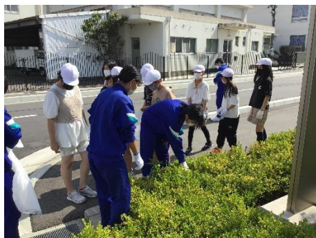
【役場前での清掃活動】

今年度は小学6年生にも声をかけ、中学3年生と一緒に役場周辺の清掃活動を行うことで、小中連携した取り組みとした。一生懸命清掃活動に取り組み子どもたちの生き生きとした姿がとても頼もしく、印象的であった。