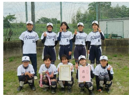
木曾岬中学校ソフトボール部