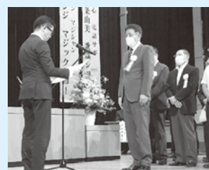
地域安全活動功労団体 木曾岬町社会福祉協議会