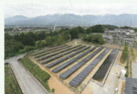
リユース品を使用した発電所