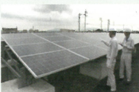
太陽光発電設備の検査の様子

使用済みとなった太陽光パネルには、再販売可能なものもあり、既に多くのリユース事例が報告されています。