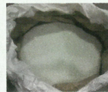
破砕・選別したガラス