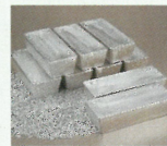
有用金属(銀)のイメージ