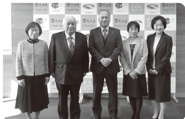
退任された委員の皆さま方