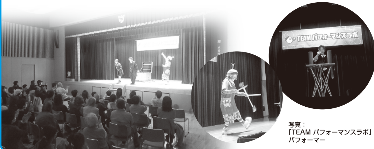
写真： 「TEAM パフォーマンスラボ」 パフォーマー

11月30日(日)に町民ホールにおいて、「TEAM パフォーマンスラボ」による公演を開催しました。名古屋を中心に全国で活動中のエンターテインメントチームで、公演当日は町内外から190名が来場し、クラウンの楽しいパフォーマンスとイリュージョンマジックが交互に披露されました。クラウンの会場全体を巻き込んだ観客参加型パフォーマンスでは笑いの声で終始会場が一体感に包まれ、イリュージョンマジックでは“人が消える”“宙に浮かぶ”といったパフォーマンスに驚きの声が上がりに盛り上がりしました。