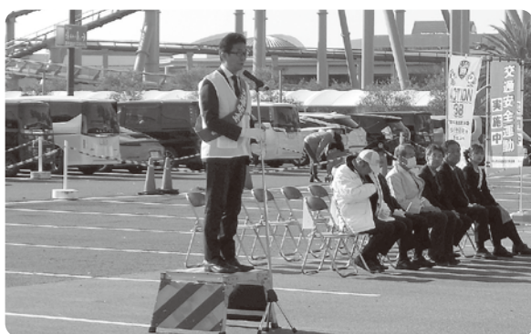
挨拶する桑名市長

出発式には、町内から、森副町長と防犯活動団体として、きそさき防犯パトロール隊と東部地区防犯委員会が参加し、桑名市長、桑名警察署長による挨拶・視閲・激励の後、警察、防犯活動団体からなる車両部隊が出発し、管内のパトロールを実施しました。