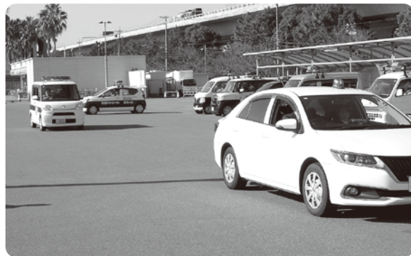
出発する車両部隊