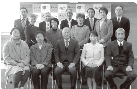
新委員の皆さま方