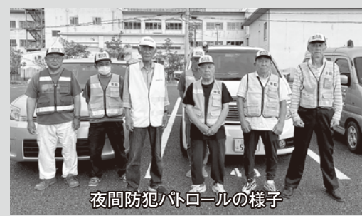
夜間防犯パトロールの様子

木曾岬町東部地区防犯委員会、きそさき防犯パトロール隊では、月に2～3回、夜間防犯パトロールを実施し、不審者や不審車両がないか見回りを行っています。