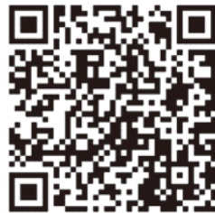
↑ 啓発動画はこちらから